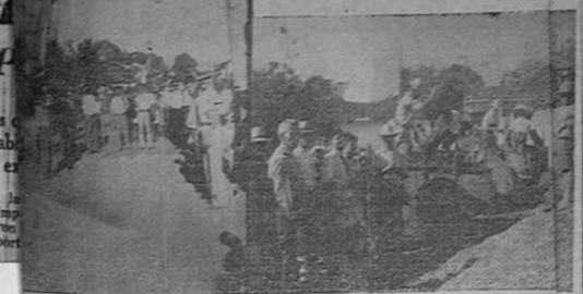
Recoge el grabado, izquierda, el desfile de las noventa carretas en la ciudad de Alajuela. Derecha, los vehículos descomulgando el material traído.